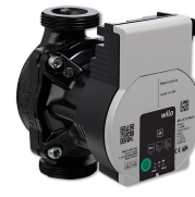
UP 25/7.5 PCV