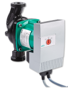
UP 30/1-8 PCV